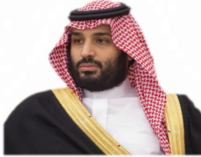
صاحب السمو الملكي

الأمير محمد بن سلمان بن عبدالعزيز آل سعود